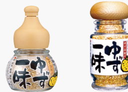
ゆず谷村のゆず一味