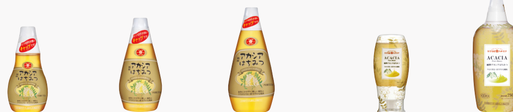
純粋アカシアはちみつ シャイン・ゴールド・ラベル