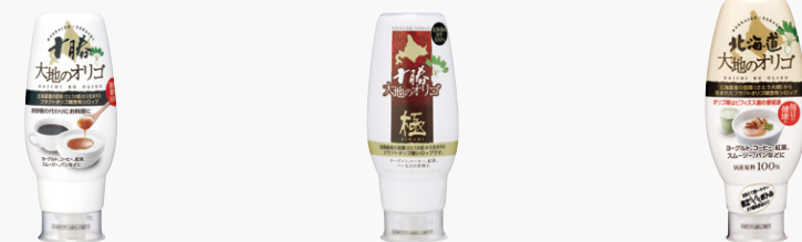
十勝大地のオリゴ