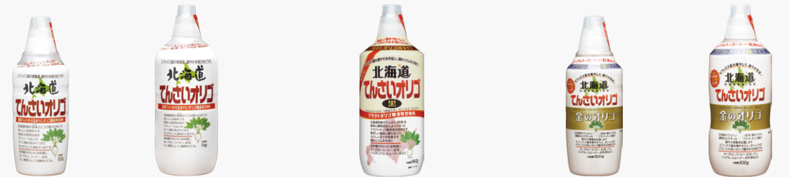
北海道てんさいオリゴ