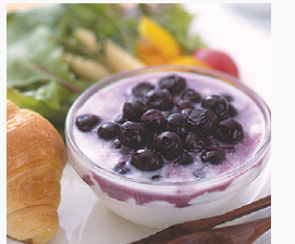
美蜂園 はちみつブルーベリー