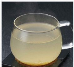
はちみつ&しょうが