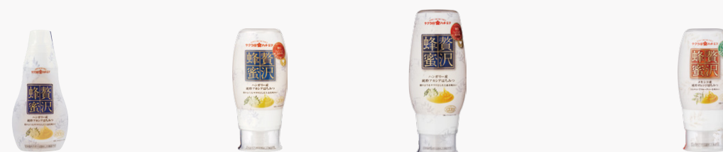
贅沢蜂蜜 ハンガリー産 純粋アカシアはちみつ