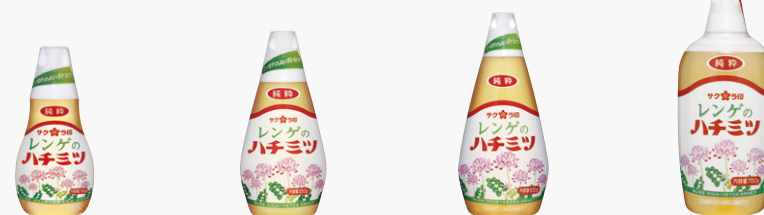
純粋レンゲのハチミツ