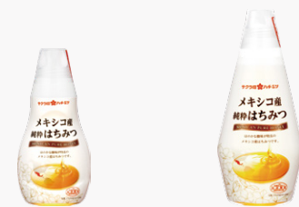
メキシコ産純粋はちみつ