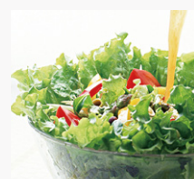
ゆず谷村 馬路村ゆずノンオイルドレッシング(ゆずごしょう味)