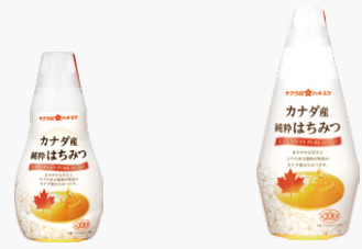
カナダ産純粋はちみつ