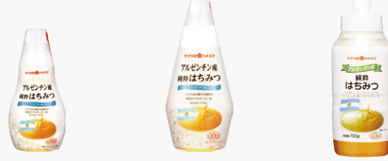
アルゼンチン産純粋はちみつ