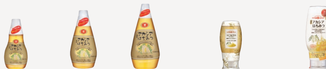
純粋アカシアはちみつ シャイン・ゴールド・ラベル