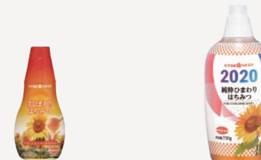
純粋ひまわりはちみつ