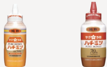
純粋ハチミツ (ホワイトキャップ)