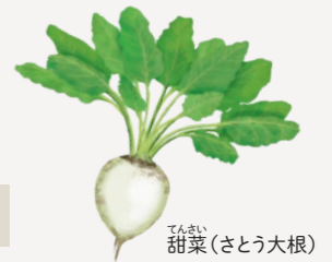
てんさい 甜菜(さとう大根)