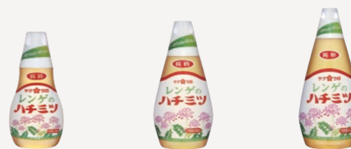
純粋レンゲのハチミツ